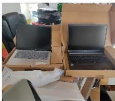
EQUIPOS ÀREA ADMINISTRATIVA